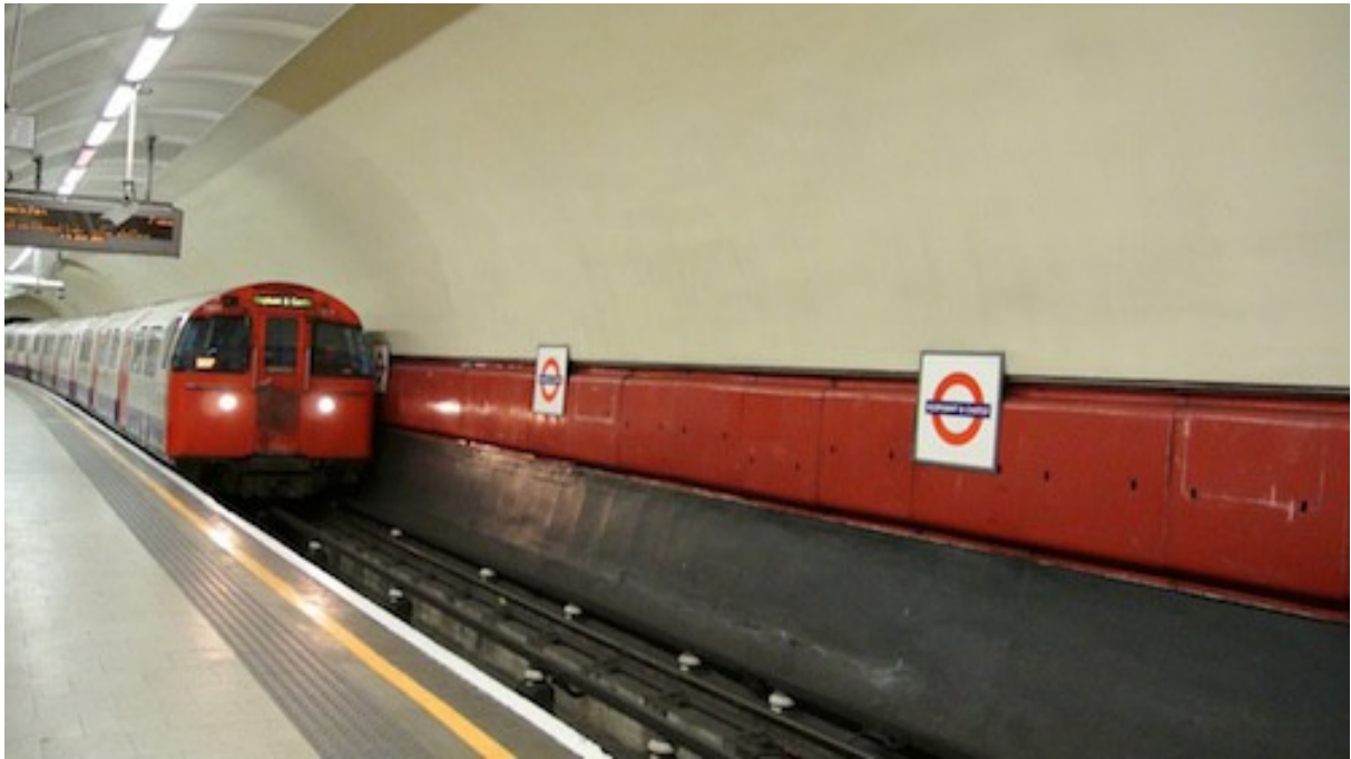
Carmen Mariscal© 2017

Images de trains à la station de métro Elephant and Castle et images de la maison d'enfance de Virginia Woolf, avec la voix de la comédienne Anne de Boissy lisant le passage sur Judith Shakespeare dans Une Chambre à Soi , et la voix enregistrée de Virginia Woolf par la BBC en 1937.